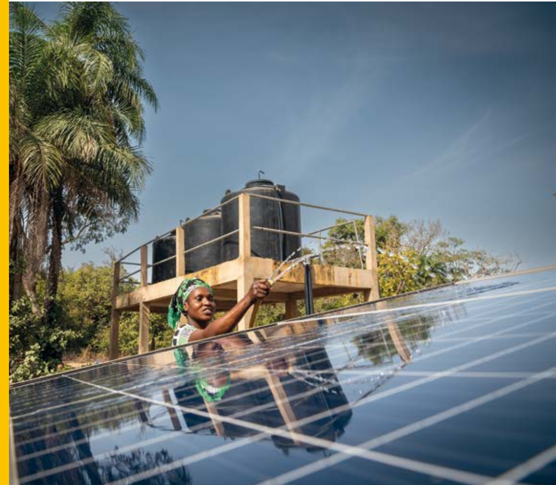
sur le périmètre Ghamoune

Grâce à la mécanisation de l'exhaure d'eau par l'installation de pompes solaires et d'un système d'irrigation sobre et efficace de type californien, leur bien-être et celui de leur famille sont préservés. En effet, cette modernisation technique préserve la santé des femmes qui ne sont plus obligées de porter des charges lourdes et d'arroser manuellement. Ce gain de confort et de temps a entraîné une nette augmentation de la productivité des parcelles maraîchères et a permis à certains groupements de doubler leurs revenus par rapport aux années précédents. Les femmes sont désormais passées d'une agriculture de subsistance à une agriculture productive, gage de leur émancipation.