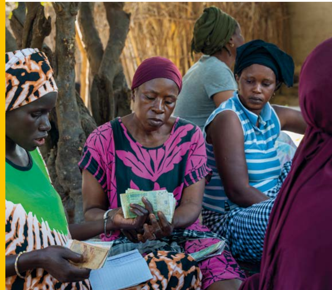
sur le Périmètre Diagho

Pour finir, des formations entrepreneuriales à destination des femmes ainsi que des actions de sensibilisation sur l'égalité des genres ont été mises en place.