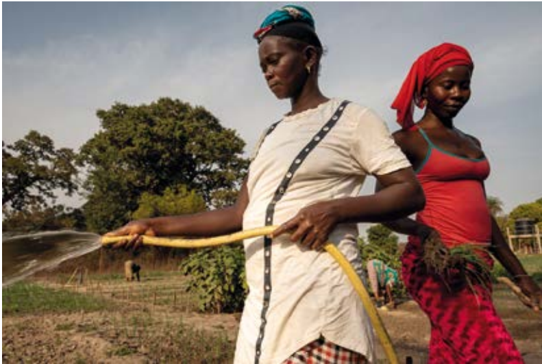
sur le périmètre Oufoulou

Au Sénégal, comme dans la plupart des pays de la sous-région, les activités agricoles ne bénéficient que rarement de mécanisation et d'un apport énergétique (seules 2 personnes sur 10 ont accès à l'électricité en zone rurale). C'est le cas du maraîchage alors que plus de 80% de la population active de la région de Ziguinchor (Casamance) tire ses revenus du secteur primaire.