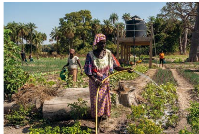
sur le périmètre Diagho

La modernisation des 7 périmètres maraîchers par l'installation de pompes solaires, de systèmes d'irrigation et la réhabilitation des puits existants doit permettre aux GPF d'améliorer leurs conditions de travail et d'accroître leurs revenus, mais aussi de réduire, grâce à des ateliers de sensibilisation dédiés, les inégalités liées au genre.