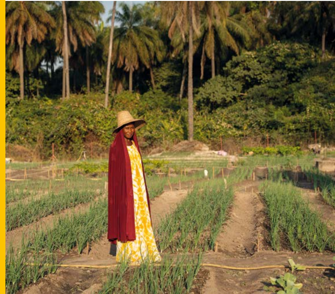
sur le Périmètre Diagho

Ces bonnes pratiques, comme par exemple l'élaboration d'un planning d'arrosage, pourront ensuite être partagées au sein de toute la communauté afin d'encourager la pérennisation de la pratique agricole vivrière pour les générations futures.